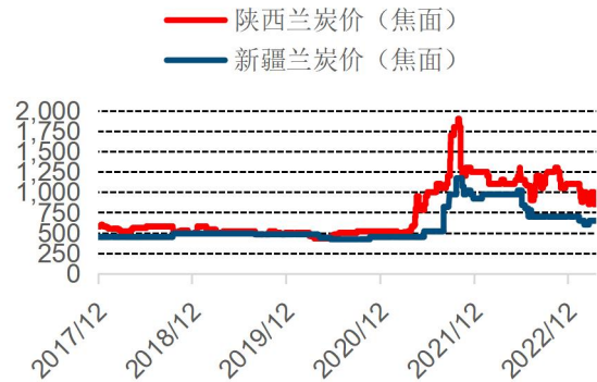
图表 5： 陕西和新疆兰炭价格走势（元/吨）