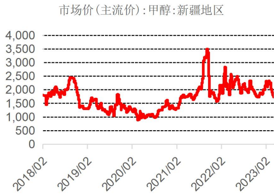
图表 6：新疆地区甲醇价格走势（元/吨）