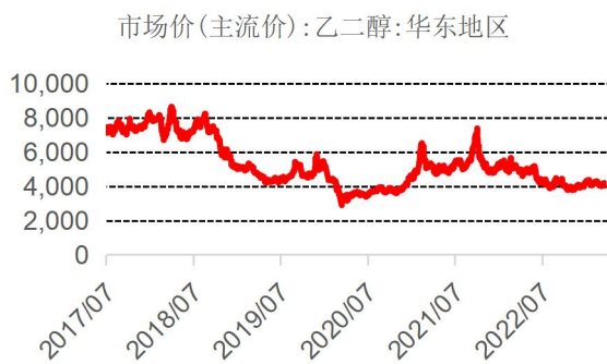
图表 8：华东地区乙二醇价格走势（元/吨）