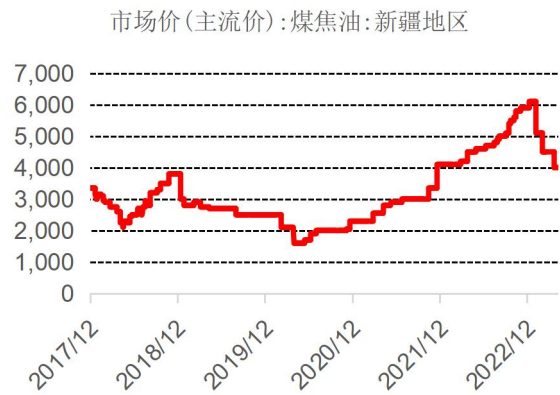
图表 7：新疆地区煤焦油价格走势（元/吨）