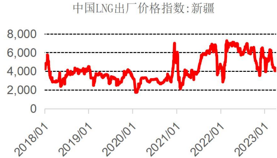
图表 3： 新疆地区 LNG 出厂价走势（元/吨）